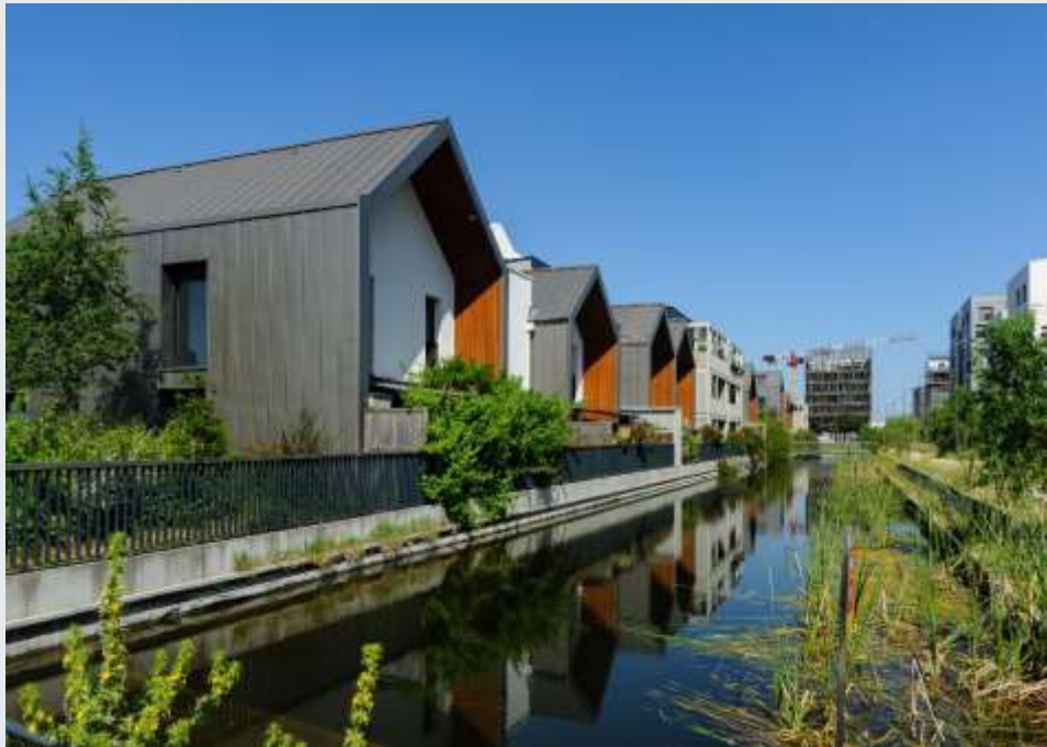
L'écoquartier Ginko

Ce projet s'intégrera donc au sein de l'écoquartier Ginko et participera à son développement, dans une démarche écoresponsable et innovante puisqu'il s'agira du tout premier projet basé sur le principe de « bâtiment frugal » selon le référentiel de la Ville de Bordeaux.