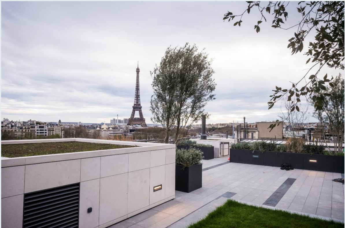
Vue terrasse